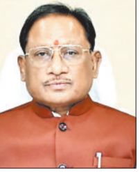
■ जल्द शुरू होगा सड़क का निर्माण, पर्यटन को मिलेगा बढ़ावा

आवागमन में सुविधा होगी, बल्कि क्षेत्र में पर्यटन की संभावनाओं को भी बल मिलेगा। खासकर महादेवश्वर पहाड़ और मयाली डेम जैसे पर्यटन स्थल सड़क सुविधा से बेहतर तरीके से जुड़ेंगे, जिससे यहां आने वाले पर्यटकों की संख्या में वृद्धि होगी। ग्रामीणों का कहना है कि अब तक इन स्थलों तक पहुंचना कठिन था, विशेषकर बरसात के दिनों में। सड़क निर्माण के बाद यात्रियों, श्रद्धालुओं और पर्यटकों को किसी तरह की असुविधा नहीं होगी। साथ ही क्षेत्रीय अर्थव्यवस्था को भी गति मिलेगी क्योंकि पर्यटन से जुड़े रोजगार के नए अवसर खुलेंगे। स्थानीय जनप्रतिनिधियों ने मुख्यमंत्री का आभार जताते हुए कहा कि यह कार्य क्षेत्र के सर्वांगीण विकास की दिशा में ऐतिहासिक कदम साबित होगा।