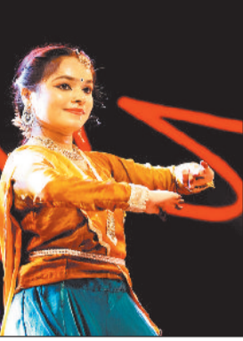
हरिभूमि न्यूज ►► रायगढ़